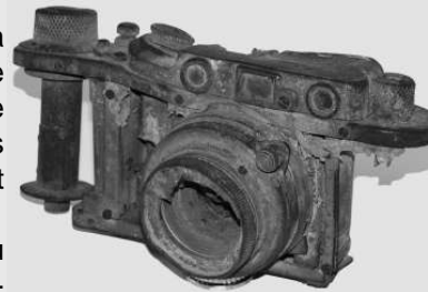
Caméra brûlée (Leica II, 1936), prêtée par Fokuhl, Emden

Traduction : Florian Delehay et Claudia Heß